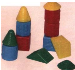
Наборы строительных кубиков.

Научите малыша снимать кольца пирамидки и надевать их на стержень. В возрасте двенадцати месяцев ребенок собирает пирамидку, не учитывая величину колец.